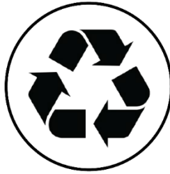
PPS 5 Desafios ECONÔMICOS, SOCIETAIS e AMBIENTAIS