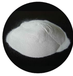
PPS 2 Materiais CERÂMICOS e CIMENTÍCIOS