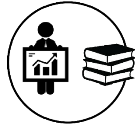
PPS 6 GESTÃO do Projeto e DISSEMINAÇÃO Técnico-Científica