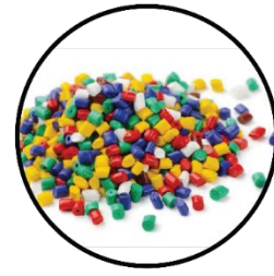
PPS 3 Materiais POLIMÉRICOS